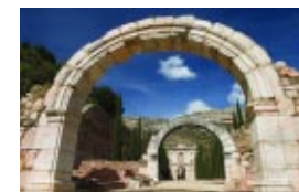
El paisaje es a la vez testimonio del pasado y expresión del presente y, como tal, forma parte de nuestro patrimonio cultural.

Para tratar de subsanar esta realidad, la Direcció General d'Arquitectura i Paisatge ha establecido cinco grandes