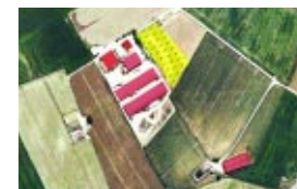
Los proyectos que tienen repercusión sobre el paisaje deben incorporar un estudio que garantice la adopción de criterios y medidas de integración.