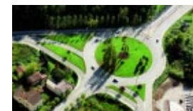
La proliferación de las rotondas, asociada a las necesidades actuales de la circulación, plantea un nuevo reto: el tratamiento paisajístico.