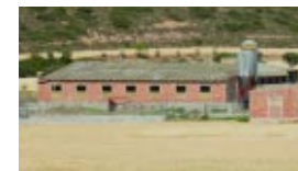
El aspecto descuidado de las instalaciones ganaderas es poco compatible con una imagen de calidad de nuestros paisajes.