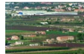
La proliferación de actividades periurbanas ha cambiado la fisonomía de muchos paisajes de Cataluña.