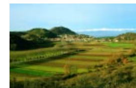
La caracterización de los paisajes de Cataluña mediante los catálogos del paisaje permitirá identificar sus valores, determinar las tendencias de los mismos y establecer objetivos de calidad que se convertirán en directrices para el planeamiento territorial y urbanístico.