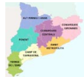
La política de paisaje se integra en los siete ámbitos del planeamiento territorial.