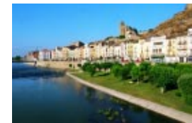
La rehabilitación de los paisajes urbanos contribuye decisivamente a mejorar la calidad de vida de los ciudadanos.

Entre las potencialidades del territorio catalán podemos citar la ventajosa posición geográfica del país, la existencia de un sistema urbano complejo y la extraordinaria diversidad paisajística. En cuanto a los procesos que habría que corregir, hay que mencionar la tendencia a la dispersión de la urbanización, la excesiva especialización funcional del espacio y la degradación de los valores paisajísticos. Para alcanzar el reto de un territorio integrado, la Generalitat de Cataluña ha adoptado un modelo de desarrollo urbano que promueve la compacidad, la complejidad y la cohesión, y ha impulsado una