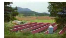
La intensificación de las actividades agrarias genera implantaciones extensas y en serie.