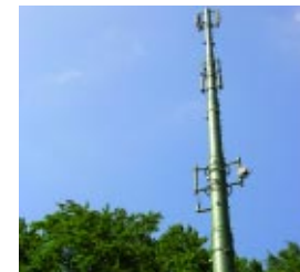
La coordinación de políticas sectoriales permite establecer criterios de integración paisajística de elementos potencialmente impactantes.

El objetivo de la Guía práctica para la integración paisajística de los polígonos industriales es proporcionar criterios, recursos y métodos útiles para contribuir a la integración de los polígonos industriales y, en general, de las áreas destinadas a actividades económicas.