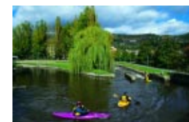
Los espacios verdes y los paisajes de calidad son espacios de deleite y ocio muy valorados socialmente.